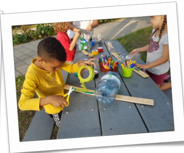
Bibliothèque Frontenac (Montréal)