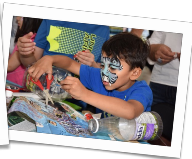
Festival Kaput 2019 (Beloeil)