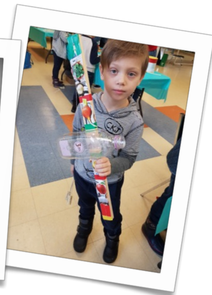
Centre Sylvan Adams (Montréal)